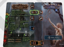
Tabelle auf der Begegnungskarte unter , welchen Bonus du in der aktuellen Etappe erhältst. In dieser Etappe erhältst du für jede aktivierte 1 . Auch der Pfeil ist ein besonderer Diplomatiebonus. Immer wenn du 1 erhältst, bewege den Marker auf der Verhältnisleiste um 1 Feld nach oben. Die Fähigkeit von Auge fürs Detail ist eine verzögerte Fähigkeit. Lege also 1 auf die Karte.